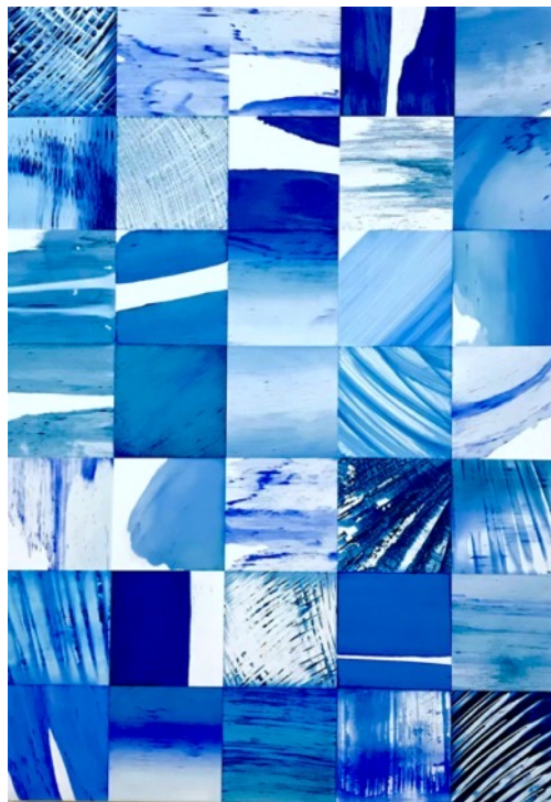
《squares(blue)_IV》 2022 シルクスクリーンペインティング 木製パネル, キャンバスにインク 845×594×40mm

シルクスクリーンの制作工程において身体を介することで生じるエラー (ノイズやブレ、ずれなど)のイメージを起点とし、「ものの捉え方」や 「視点の選択」をテーマに制作している。印刷時に現れる微妙なズレや インクの斑のエラーは、本来同じものをつくるための型から違いを持っ た別のものを創出し、その差異を発展させ、刷りという行為を通じて、 形や色そのものによる模様をイメージとして提示する。《dots》では 「地と図」の見え方、「あなたが見ているものは何か?」という問いを 内包している。